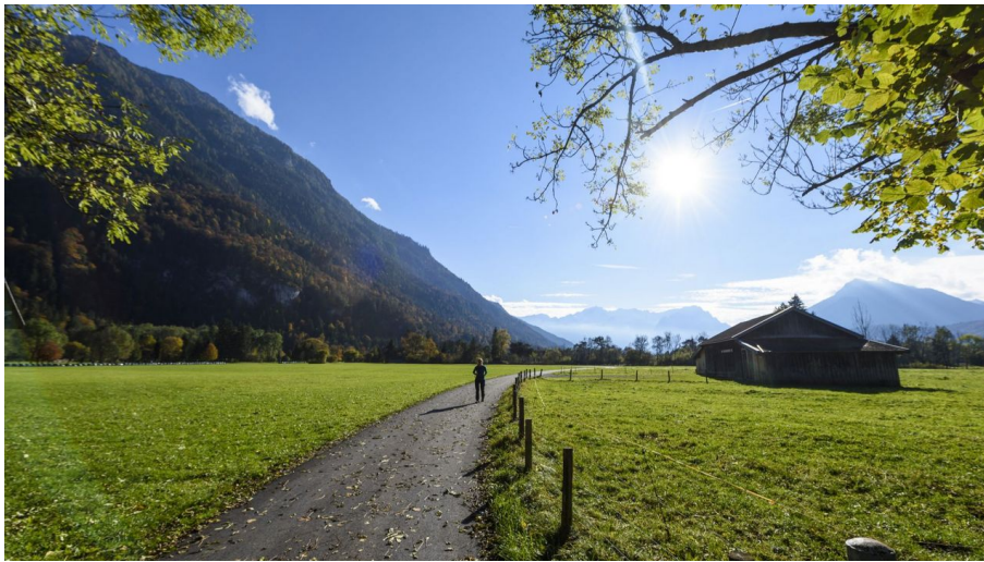
Oberau in Richtung Farchant