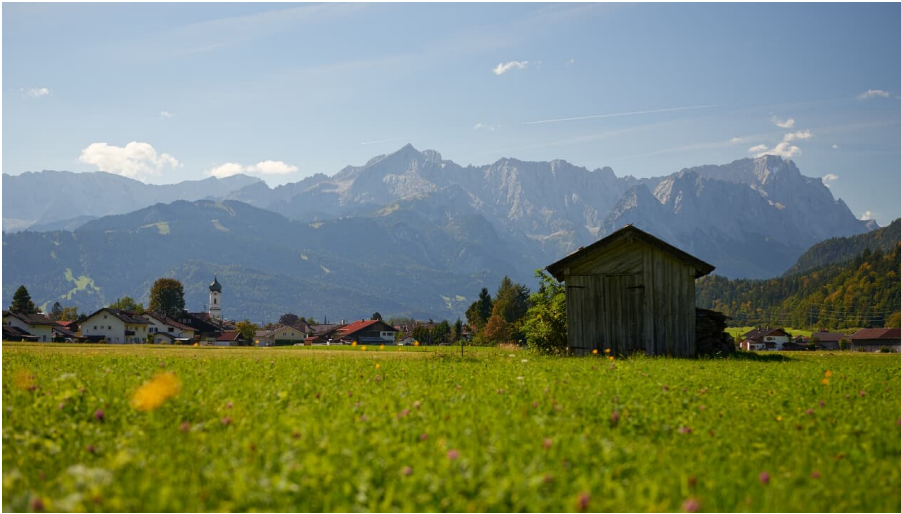
Farchant im ZugspitzLand