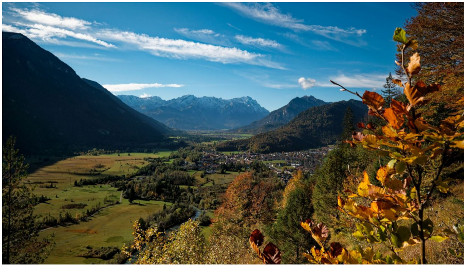
Blick von Oberau zum Wettersteinmassiv