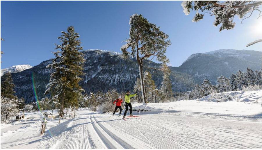
Langlaufen im ZugspitzLand