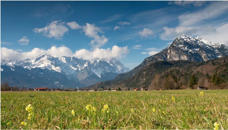
Panorama Frühling.jpg