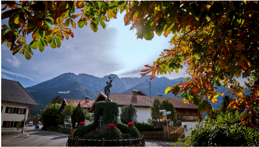
Kriegerdenkmal in der Dorfmitte