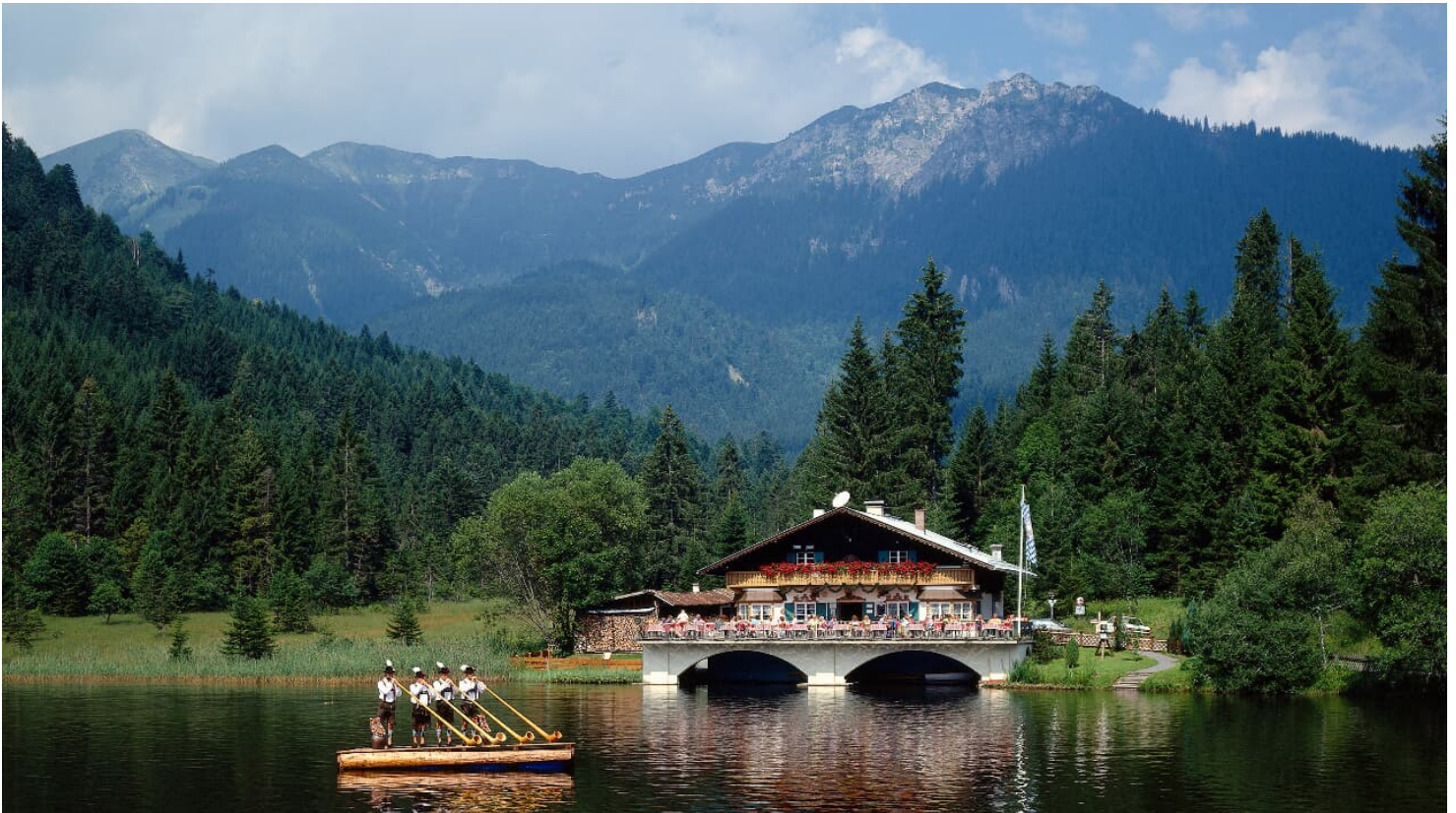
Pflegersee bei Garmisch-Partenkirchen, Oberbayern, Bayern, Deutschland

Es empfiehlt sich die Anreise mit dem Zug. Die Verbindung von München erfolgt im Stundentakt und der Beginn der Route lässt sich super ab dem Bahnhof starten!