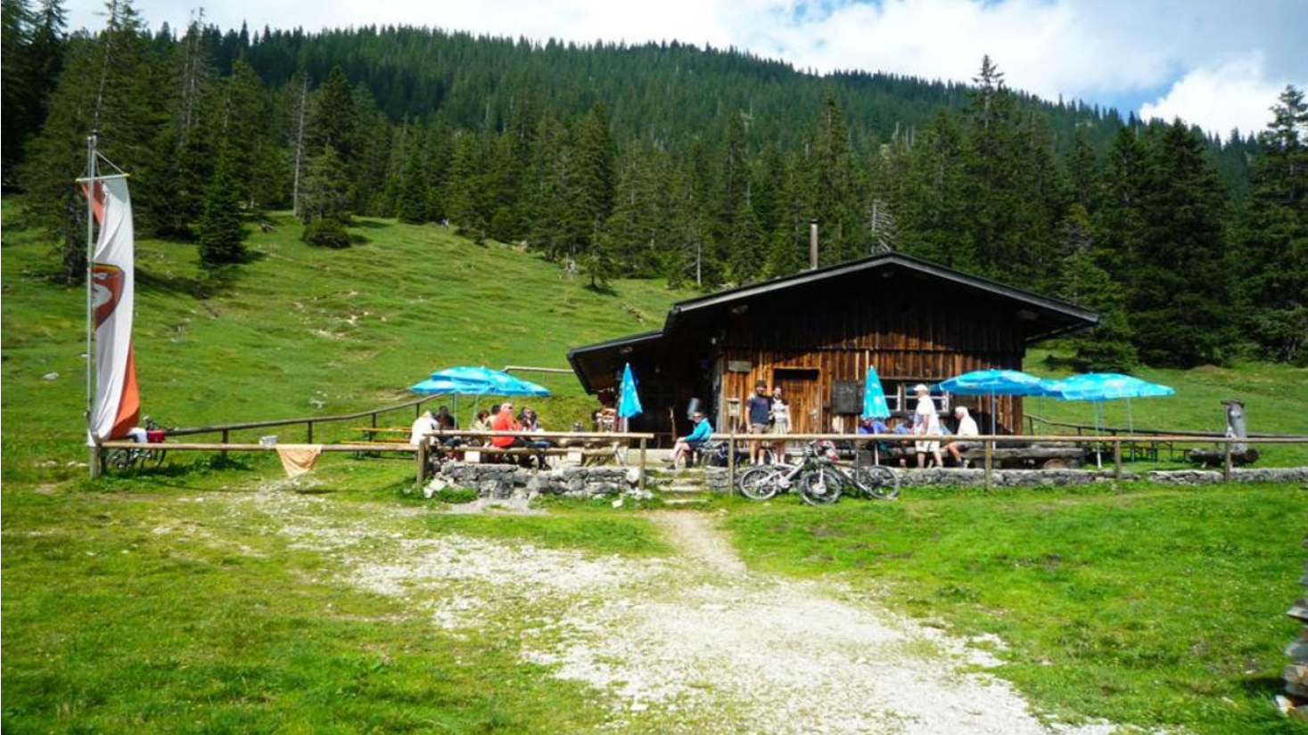
Thorsten Unseld, Touristinfo Schwangau