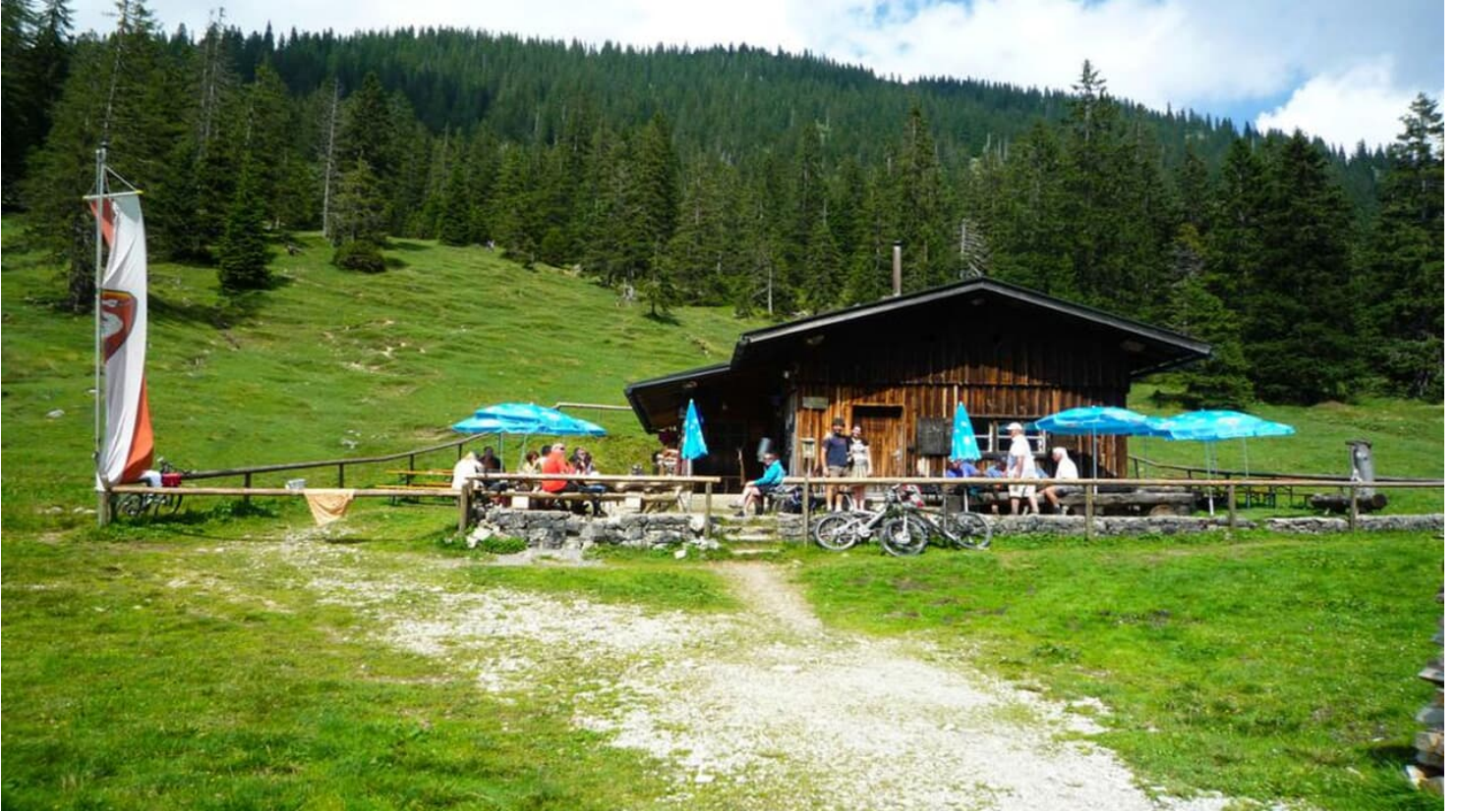
Thorsten Unseld, Touristinfo Schwangau