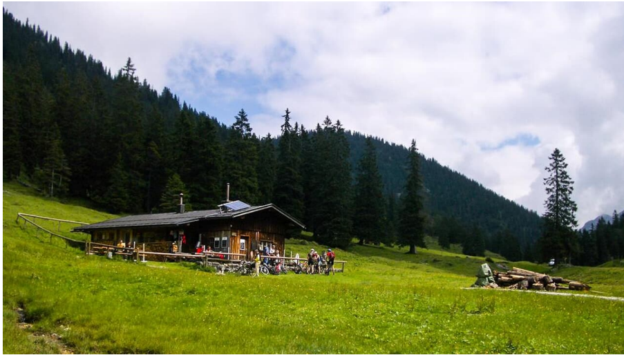
Thorsten Unsel, Touristinfo Schwangau