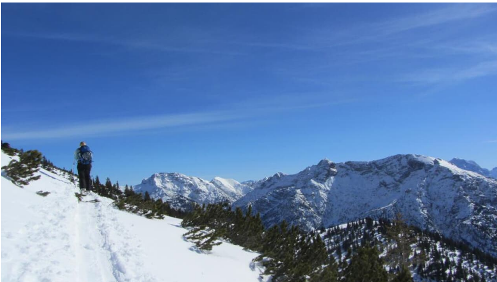
Skitour Hochblasse

Prospektmaterial ansehen und/oder bestellen