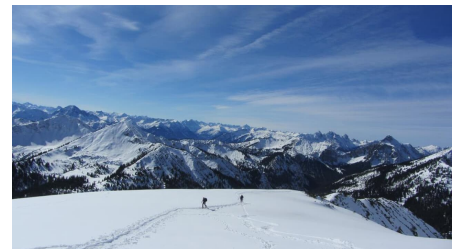
Skitour Hochblasse - kurz vor dem Gipfel