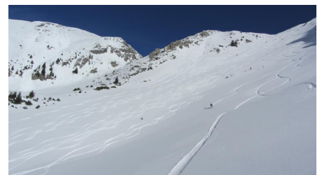
Skitour Hochblasse - Abfahrt - © Thorsten Unsel, Thorsten Unsel