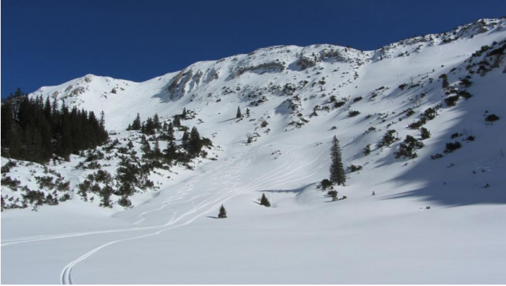
Skitour Hochblasse - Abfahrt - © Thorsten Unsel, Thorsten Unsel