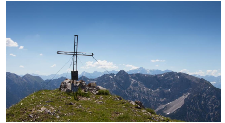
Bergtour - Hochblasse, Gipfelkreuz