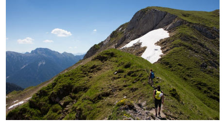
Bergtour - Hochblasse, Grat zum Gipfel