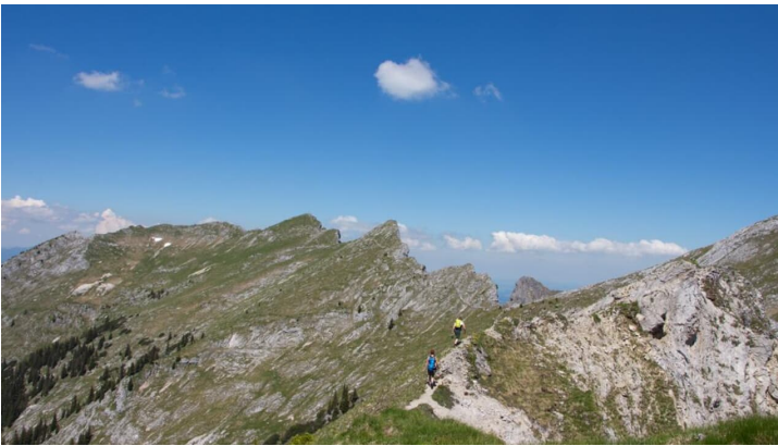
Bergtour - Hochblasse