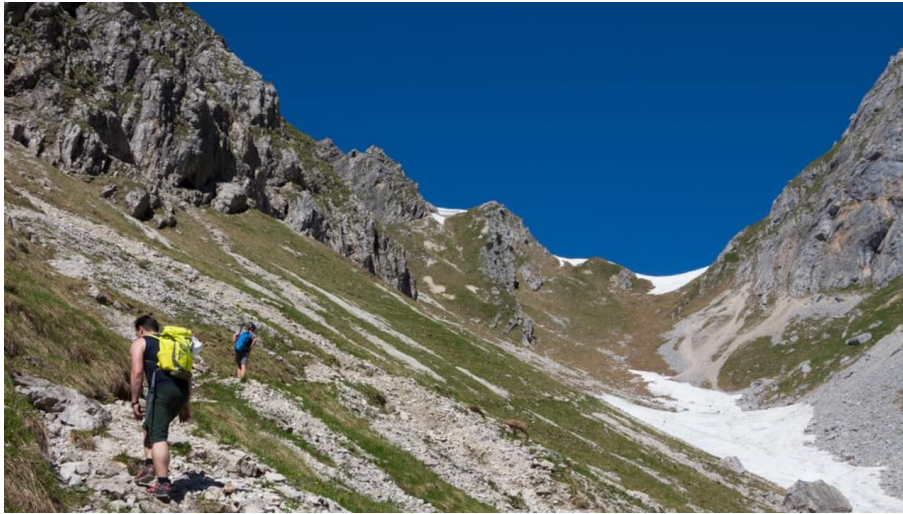
Bergtour - Hochblasse, im Roggental