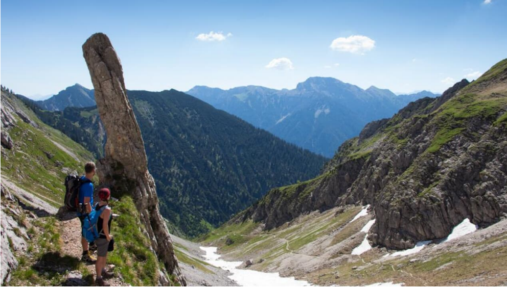
Bergtour - Hochblasse, kurz vor der Roggentalgabel