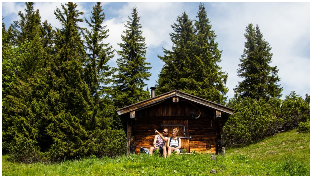
Bergtour - Weitalspitz, an der Weitalm