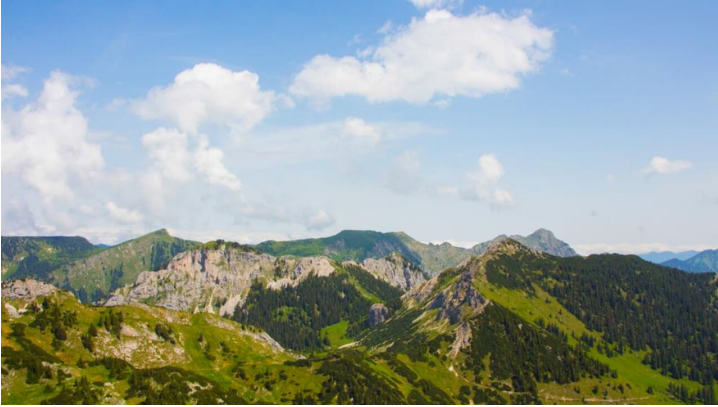
Bergtour - Weitalspitz