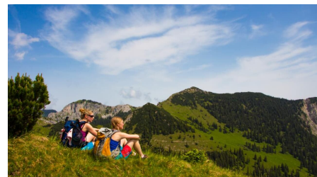
Bergtour - Weitalspitz