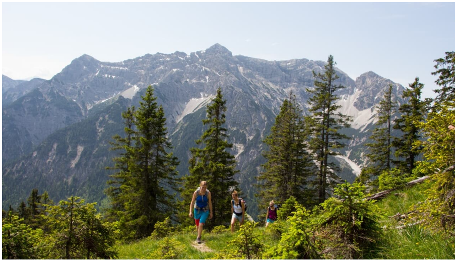
Bergtour - Weitalpispitz