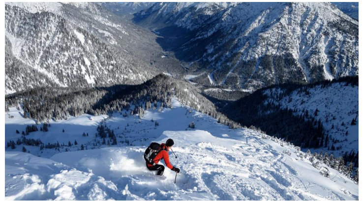
Skitour - Ochsenälpleskopf