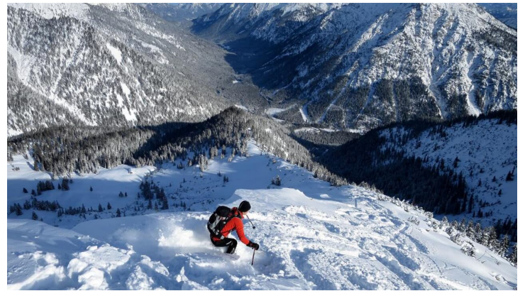
Skitour - Ochsenälpleskopf