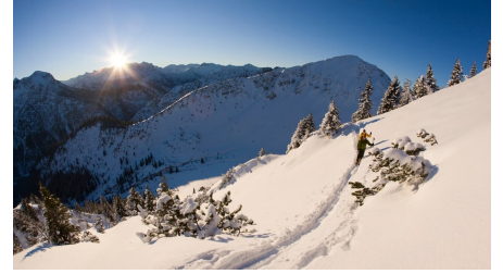
Skitour Ochsenälpleskopf