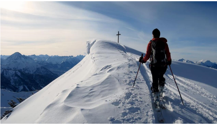
Skitour - Ochsenälpleskopf