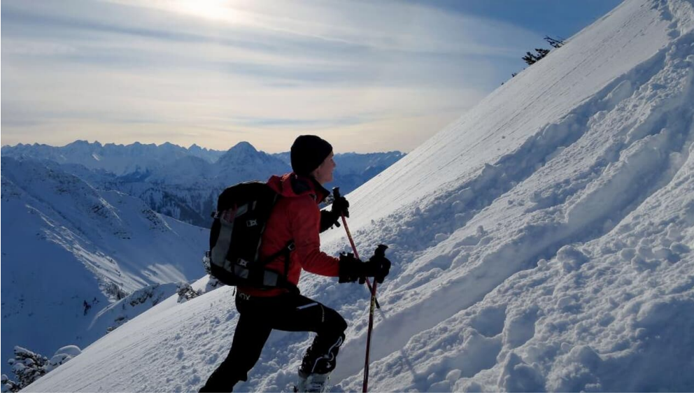
Skitour - Ochsenälpleskopf