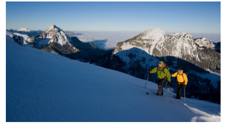
Skitour Ochsenälpleskopf