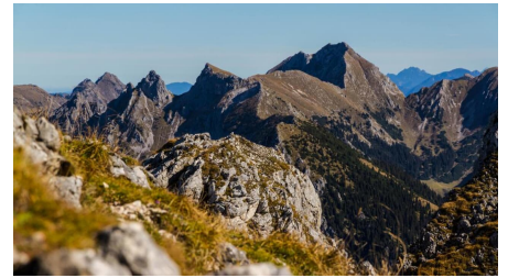
Bergtour - Hochplatte - Blick vom Säuling auf die Hochplatte - © Thorsten Unseld, Sebastian Scheibel