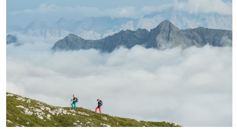
Blick von der Hochplatte auf die Zugspitze - © Simon Bauer, Naturpark Ammergauer Alpen