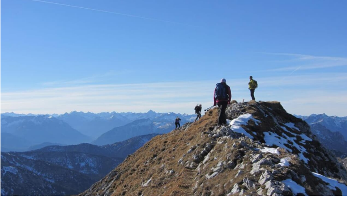
Bergtour - Hochplatte - Gipfelgrat - © Thorsten Unsel, Carolin Scheibel