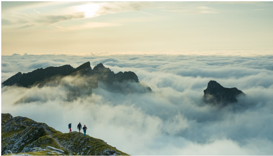
Steig auf die Hochplatte