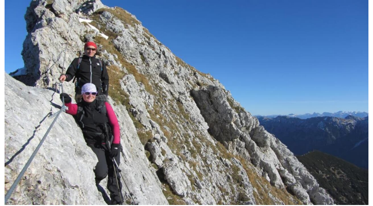
Bergtour - Hochplatte - Kletterpassage am Gipfelgrat - © Thorsten Unsel, Carolin Scheibel