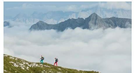
Blick von der Hochplatte auf die Zugspitze - © Simon Bauer, Naturpark Ammergauer Alpen