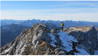
Bergtour - Hochplatte - Blick auf Lechtaler Alpen