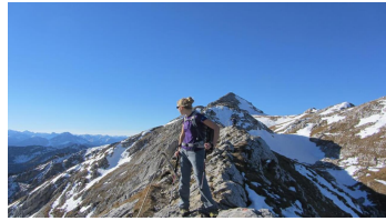
Bergtour - Hochplatte - Gipfelgrat