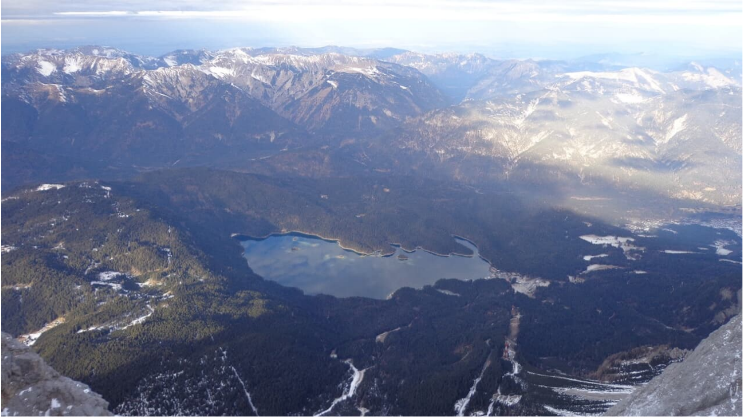
Gipfelblick von der Zugspitze auf den Eibsee