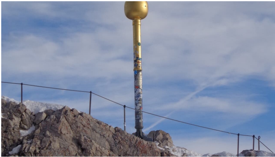
Zugspitzgipfel - © Bettina Plank, GaPa Tourismus GmbH