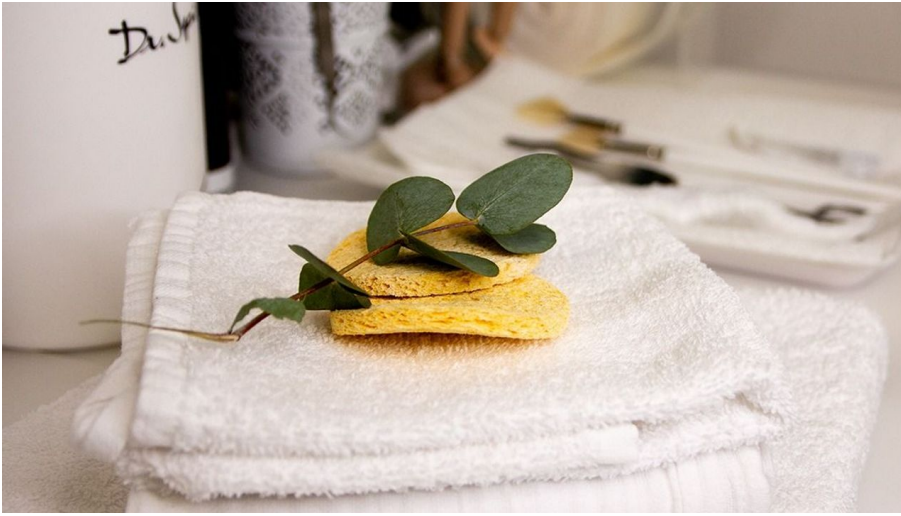
Beauty am Tivoli