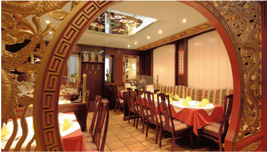
China Restaurant Kink-Lon