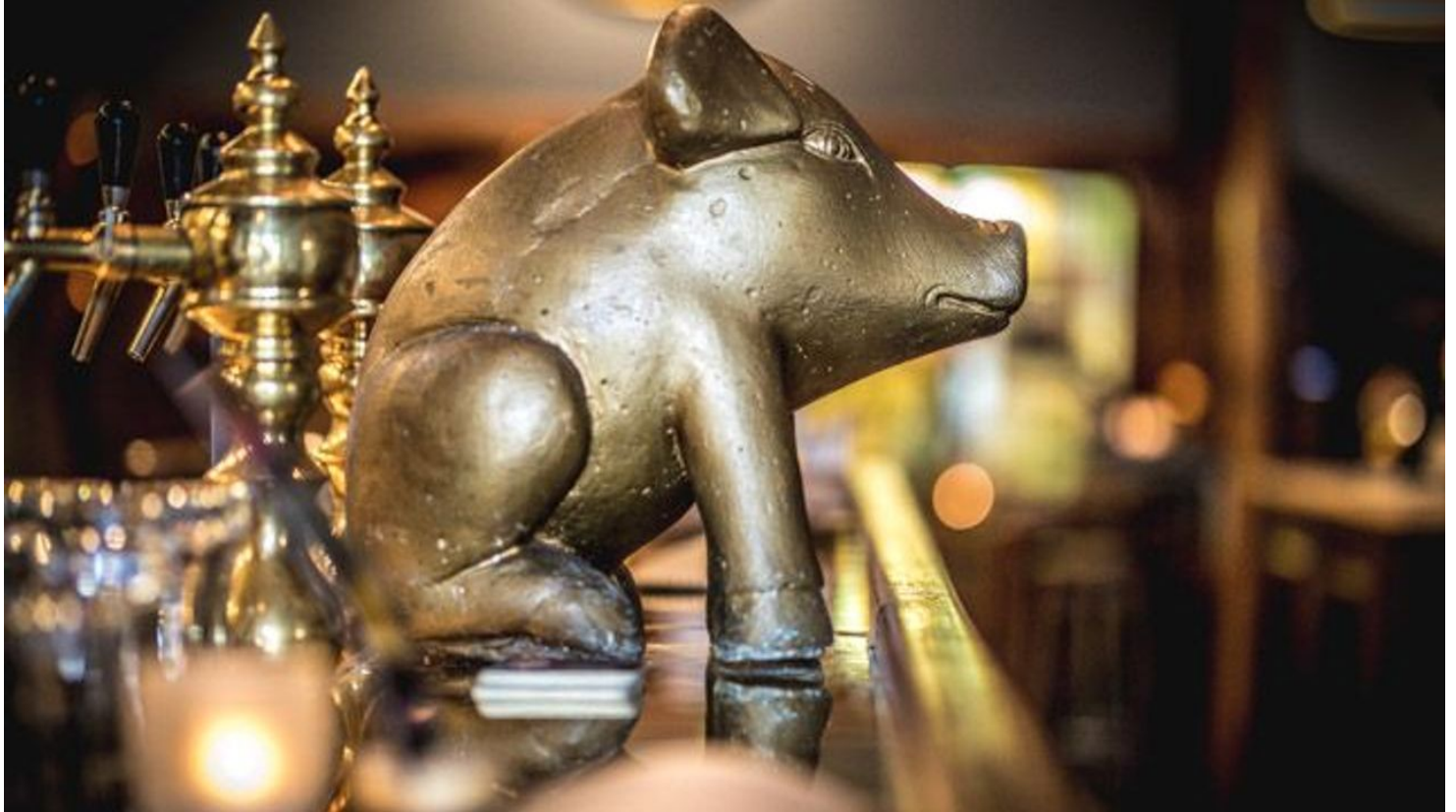
2021-10-21 Goldenes Schwein neu.jpg