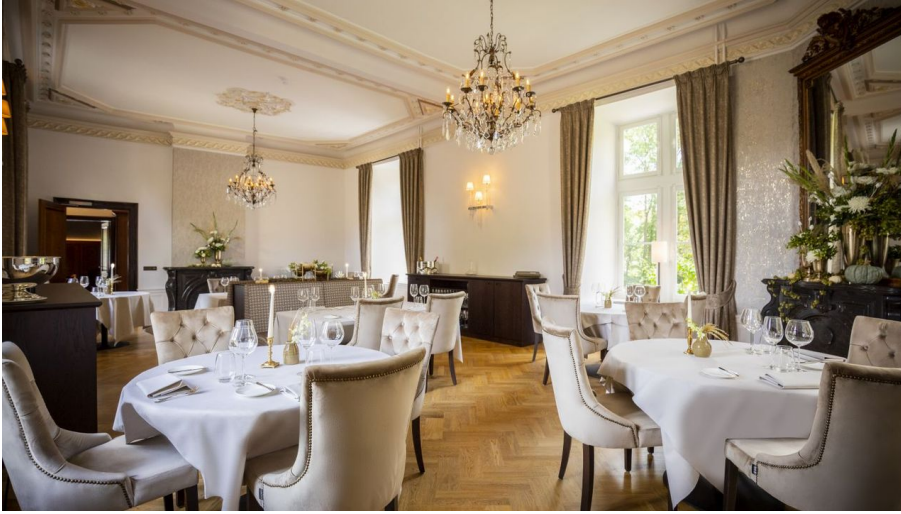
Château Wittem Restaurant Jaumont