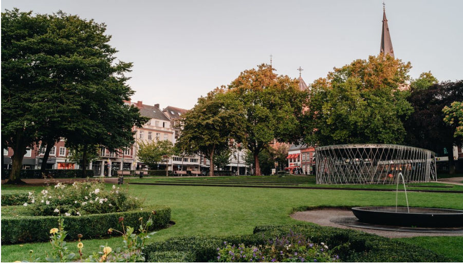
Elisengarten Aachen mit Archäologischer Vitrine