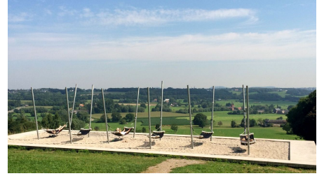
Lousberg Hängematten