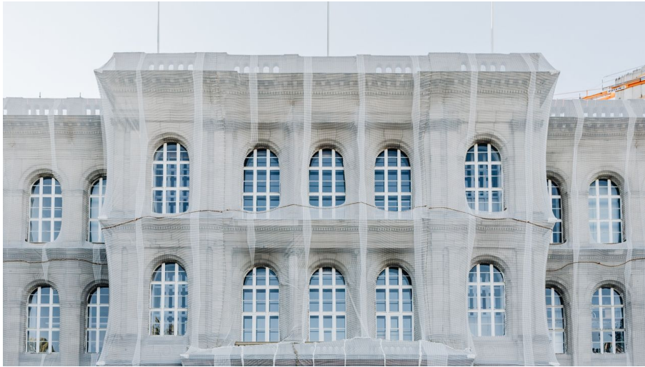
RWTH Hauptgebäude Aachen