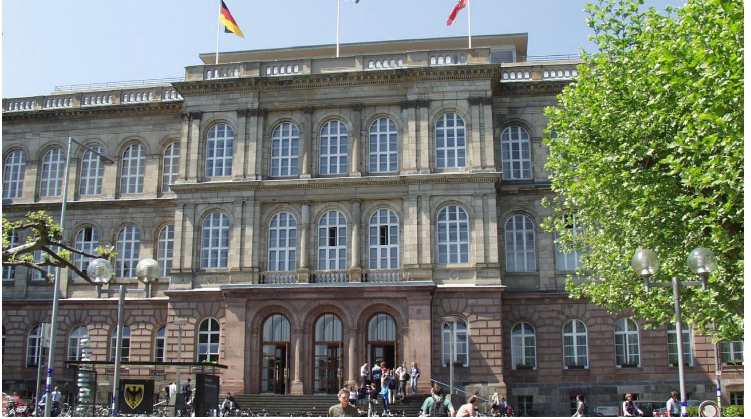
RWTH Hauptgebäude