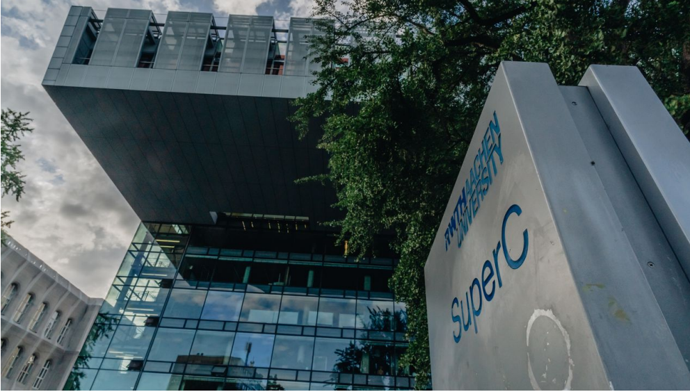
Super C Aachen mit Schild - © Tom Tietz

Quelle: destination.one ID: p_100028114 Zuletzt geändert am 22.06.2023, 09:02