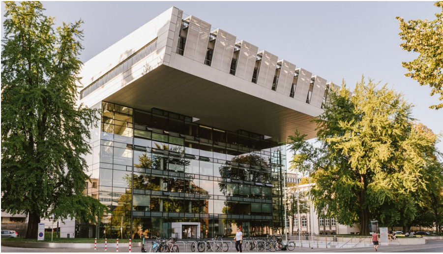
Super C Aachen

Universität/Wissenschaftliche Einrichtung