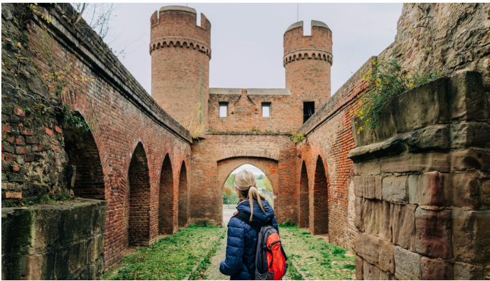
EifelSpurRömerRitterRüben, Weiertor im Park am Wallgraben, Zülpich