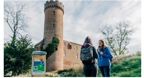
EifelSpur Römer Ritter Rüben, Stadtmauer Zülpich