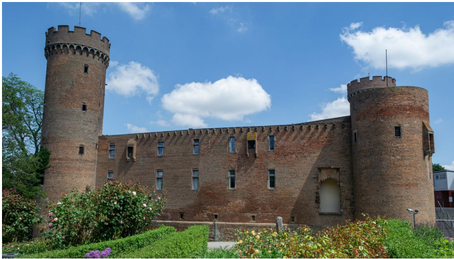
Eifelspur Römer Ritter Rüben, Landsburg Zulpich