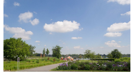
EifelSpur Römer Ritter Rüben, Parkanlage Seepark Zülpich