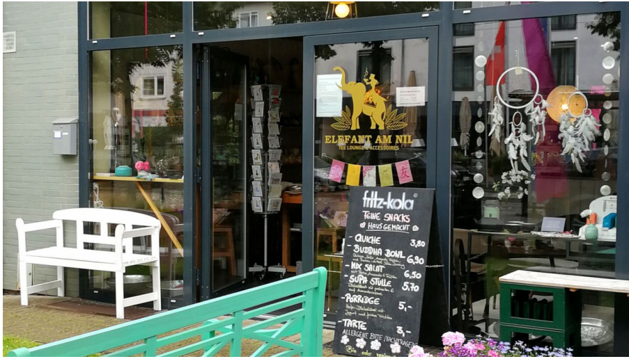
Elefant am Nil - © Elefant am Nil