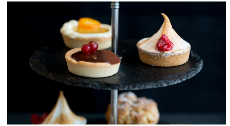
Konditorei BonPâtis