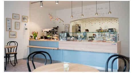
Konditorei BonPâtis - © Rebecca Petri