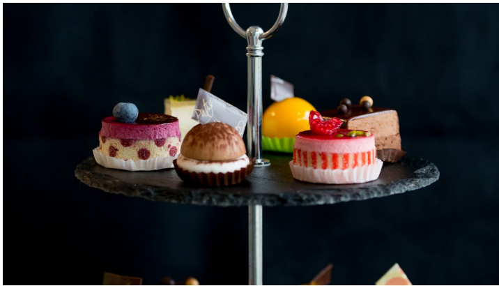
Konditorei BonPâtis