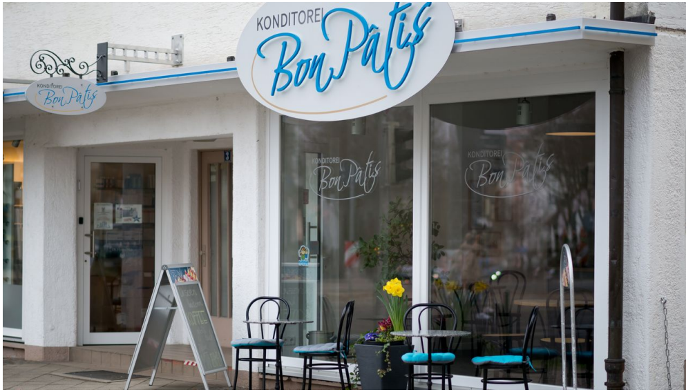
Konditorei BonPâtis - © Rebecca Petri