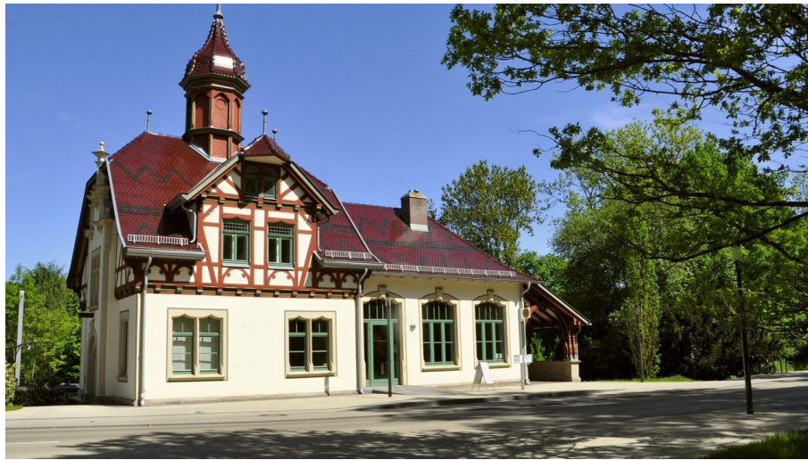
Stadt Kassel; Foto: Tobias Gründer