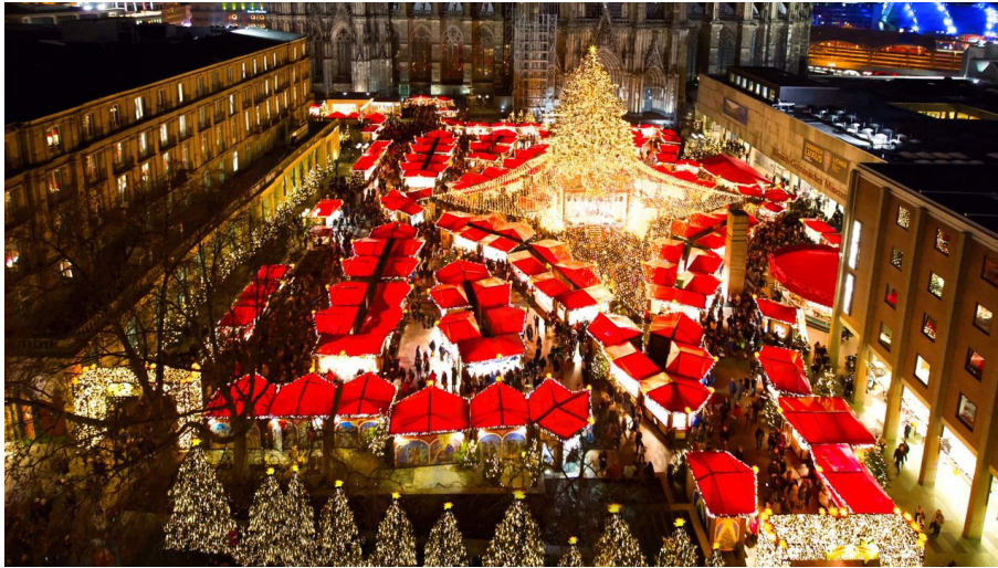
KW Kölner Weihnachtsgesellschaft mbH