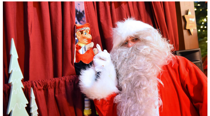
KW Kölner Weihnachtsgesellschaft mbH