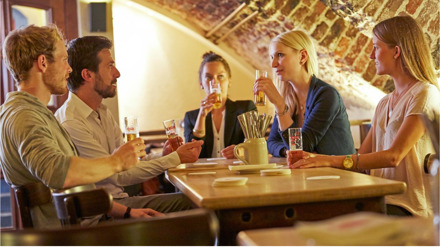
brauhaus_Früh am Dom