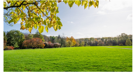
Forstbotanischer-Garten-www-badurina-de-11.jpg - © www.badurina.de