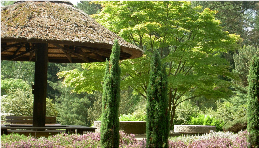
forstbotanischer-garten-dr-joachim-bauer - © Dr. Joachim Bauer