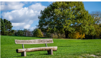
Forstbotanischer-Garten-www-badurina-de-05.jpg - © www.badurina.de