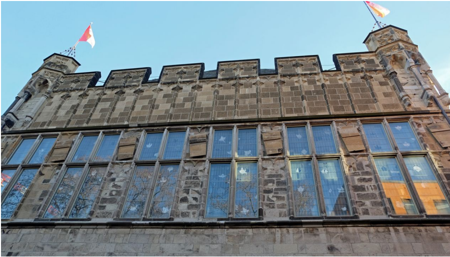
Gürzenich - © KölnTourismus, Foto: Jesse von Laufenberg