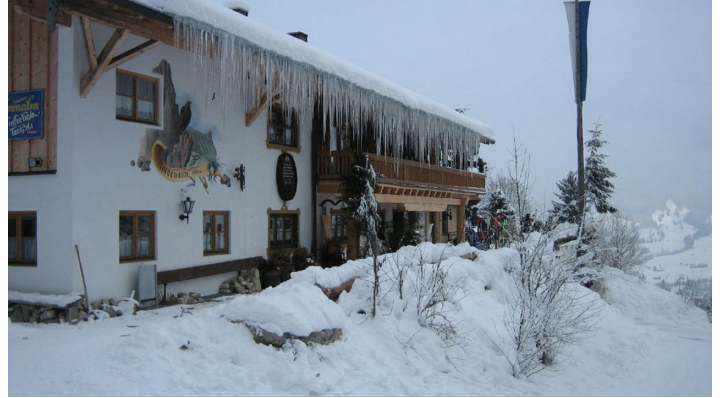
Die Kolbenalm im Winter