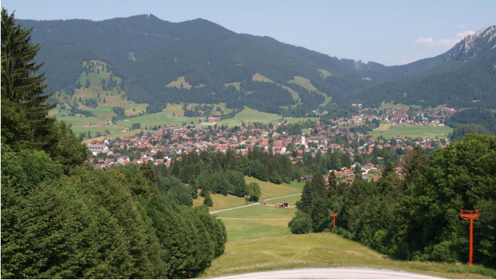
Aussicht von der Kolbenalm auf Oberammergau