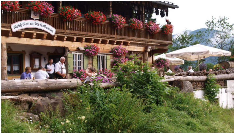
Kolbenalm im Sommer mit Aussichtsterrasse