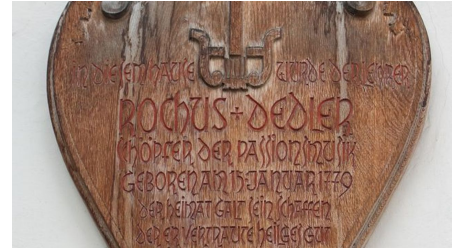
AMMERGAUER ALPEN GMBH