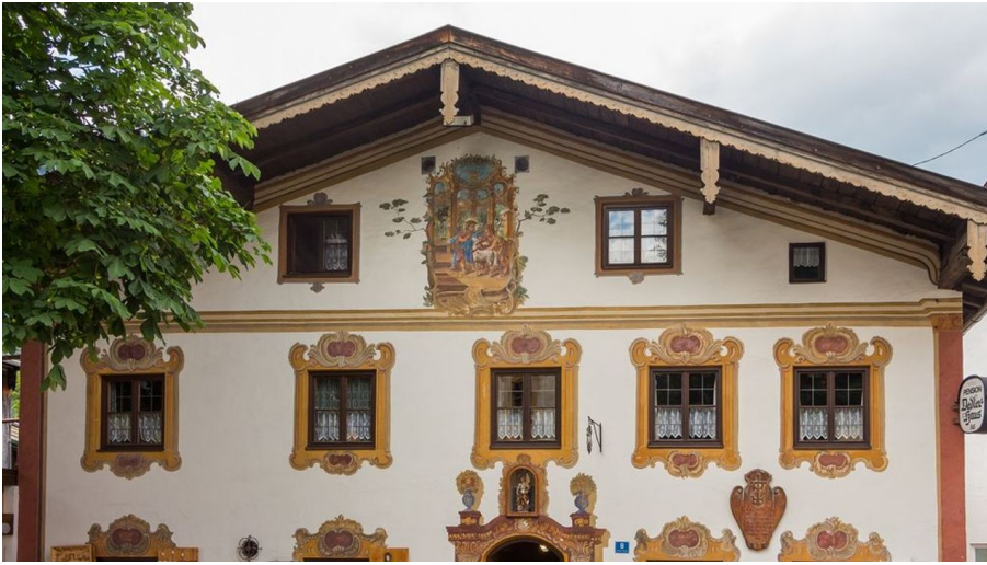
AMMERGAUER ALPEN GMBH