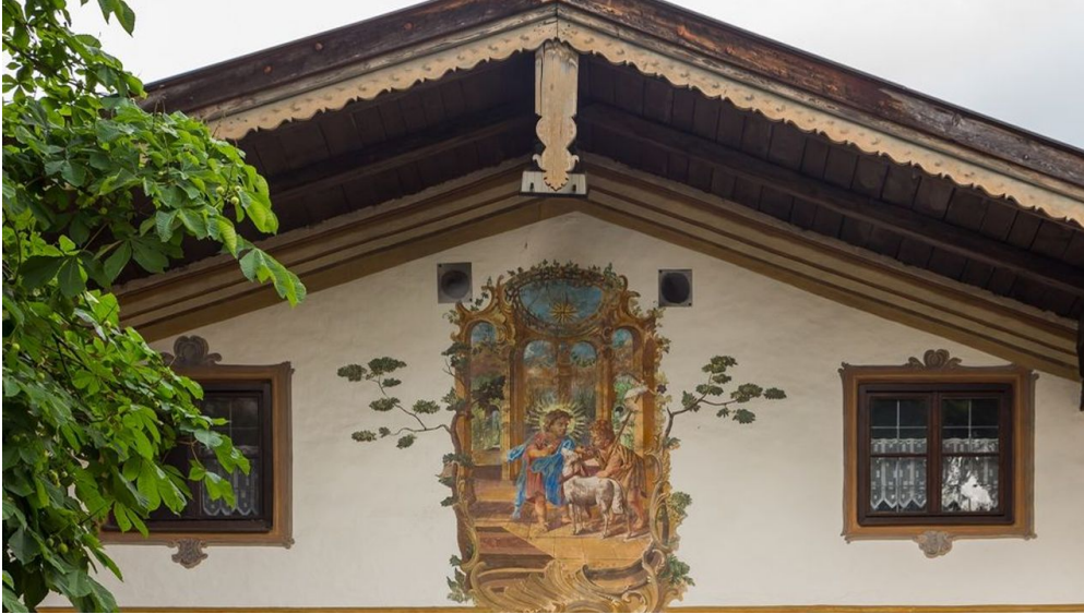
AMMERGAUER ALPEN GMBH