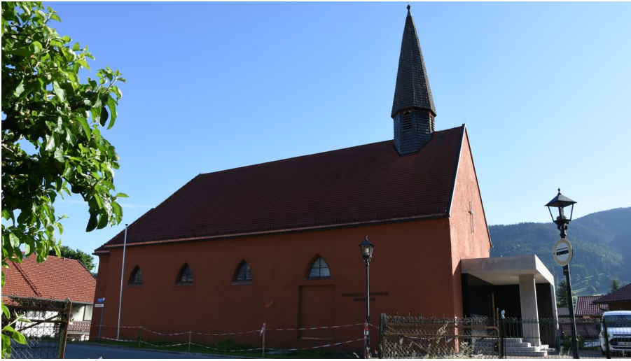
Ev. Kreuzkirche Oberammergau (9)JPG