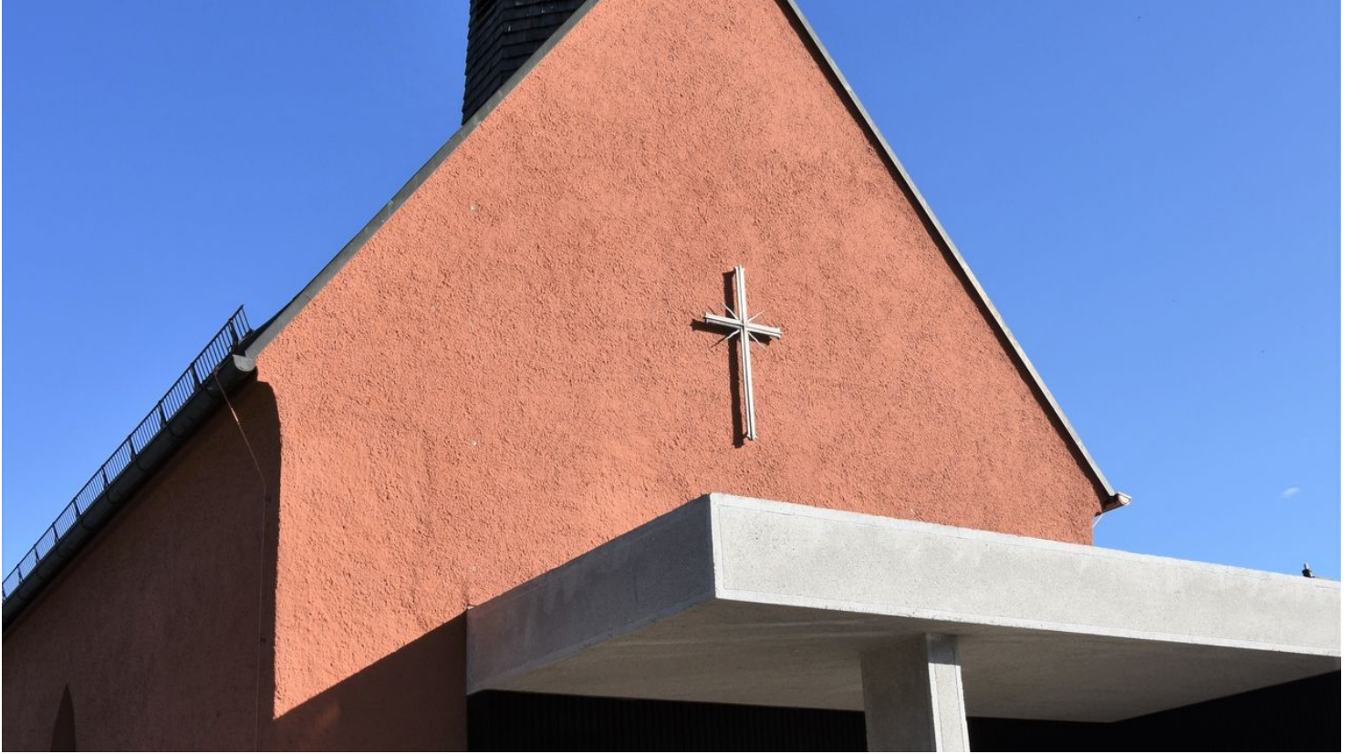
Ev. Kreuzkirche Oberamergau (10).JPG

ID: p_100117589 Zuletzt geändert am 29.01.2024, 09:54