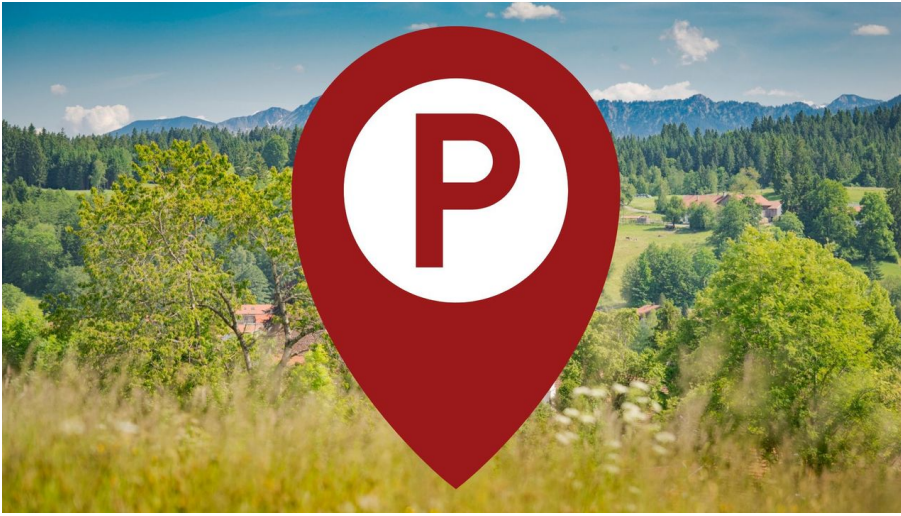
Point of Interest Parkplatz.jpg