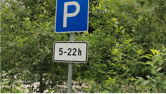
PP Halbammer Schild.jpg · © b4a98bda-80f0-443d-8e25-fd669a575309