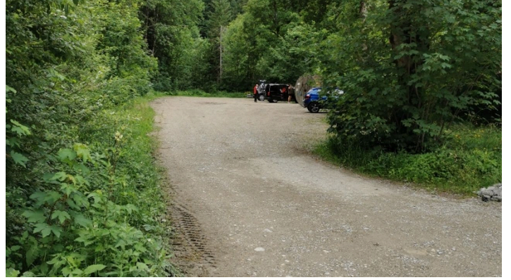
PP Halbammer.jpg