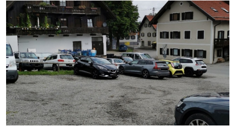
Parkplatz Prentstraße, P2 3.png