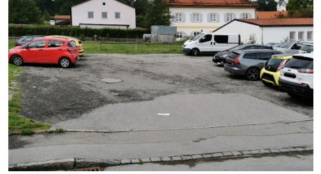
Parkplatz Prentstraße, P2 2.png