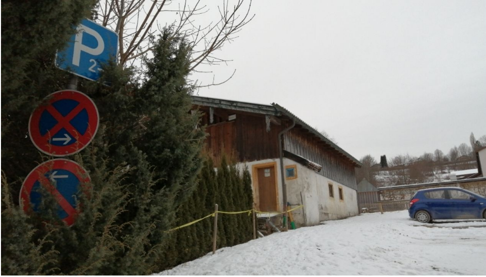
Parkplatz Prentstraße, P2 1.png