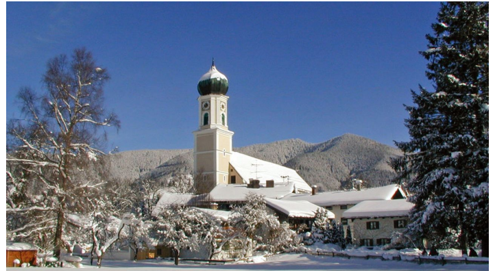
Pfarrkirche St. Peter und Paul im Winter