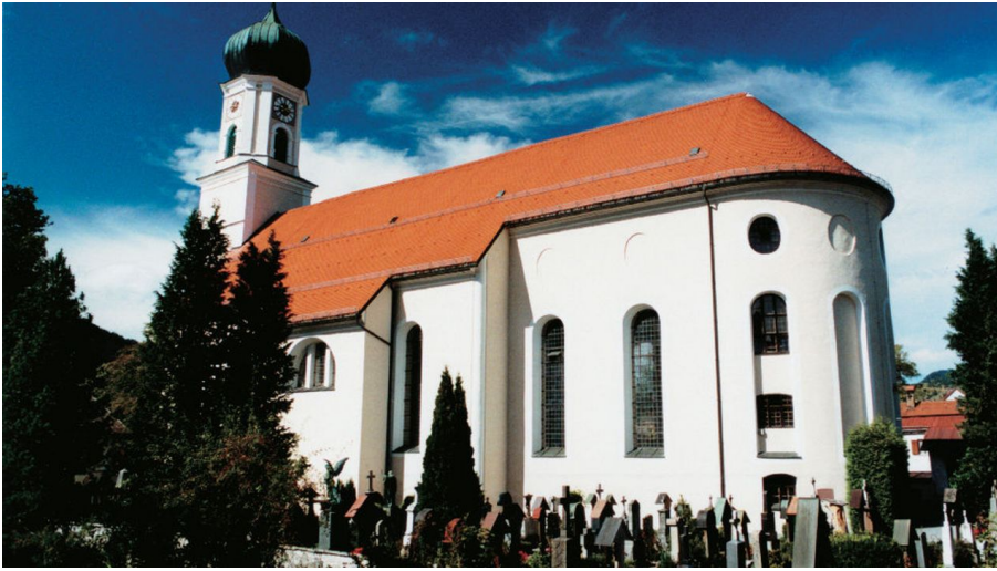
Pfarrkirche St. Peter und Paul