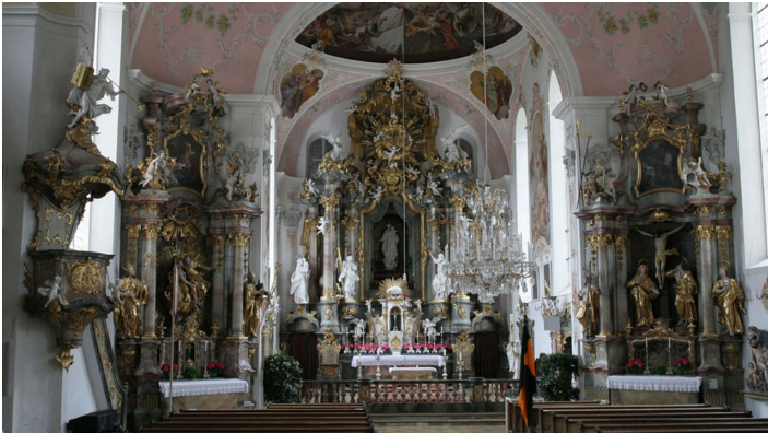
Pfarrkirche St. Peter und Paul innen

Die Altäre in den Seitenerweiterungen (ebenfalls von Schmädler) sind der Heiligen Sippe (links; Altarbild von Günther) und dem heiligen Antonius von Padua (rechts; Bild von Johann Jakob Zeiller) gewidmet.