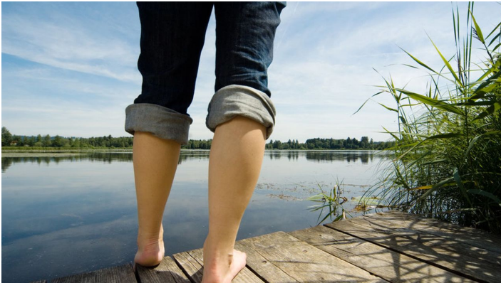
Der Soier See, ideal, um kurz mal vom Alltag abzuschalten