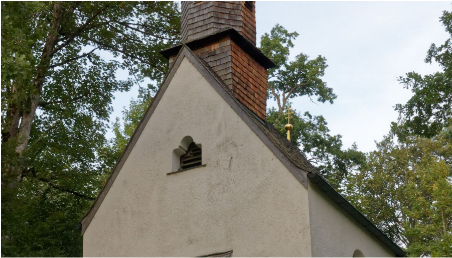
St Anna Linderhof (1).jpg