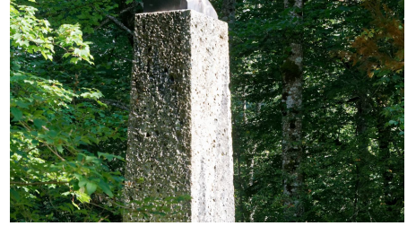
St Anna Linderhof (3).jpg