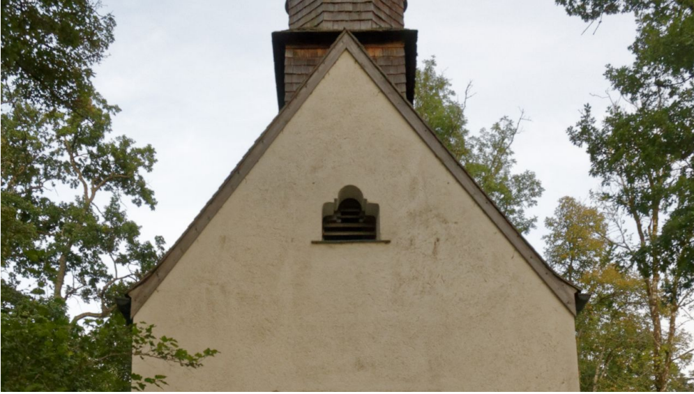
St Anna Linderhof (2).jpg