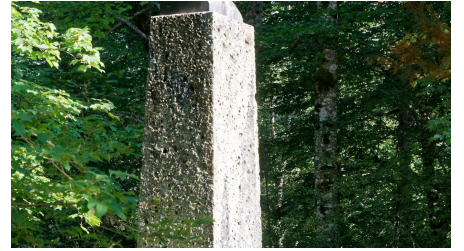
St Anna Linderhof (3).jpg