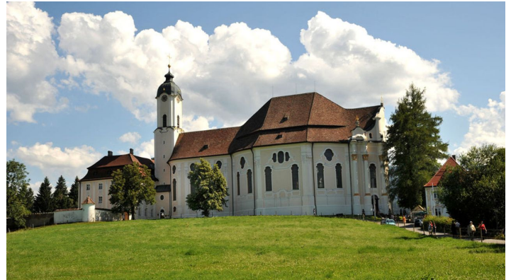
Wieskirche im Sommer