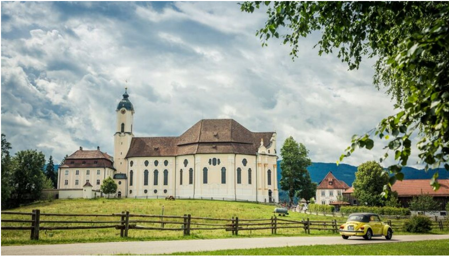
Wieskirche an der Alpenstraße