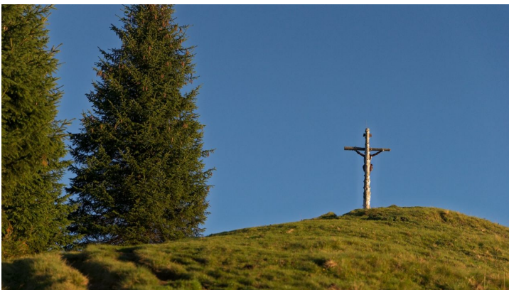
Hinteres Hörnle - © Anton Brey, Ammergauer Alpen GmbH