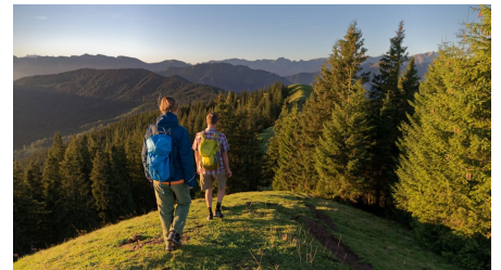
Wanderer Hinteres Hörnle Richtung Stierkopf