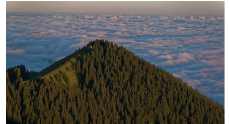
Hinteres Hörnle