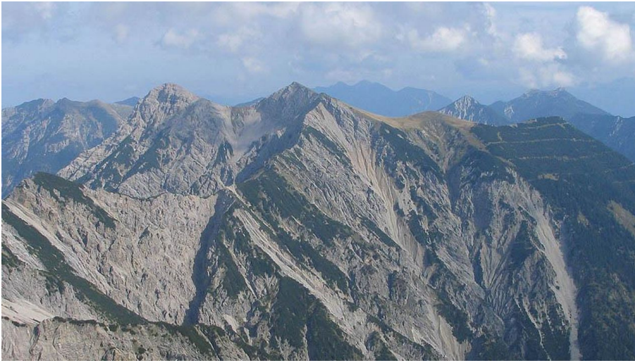
Bike and Hike Frieder - Gipfel Frieder und Friederspitz