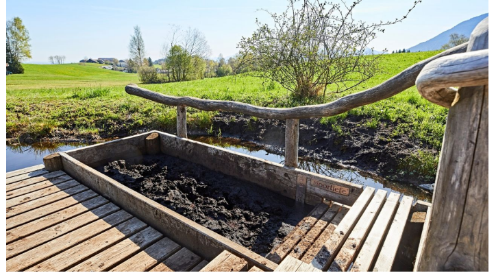
Moorlehrpfad Bad Kohlgrub