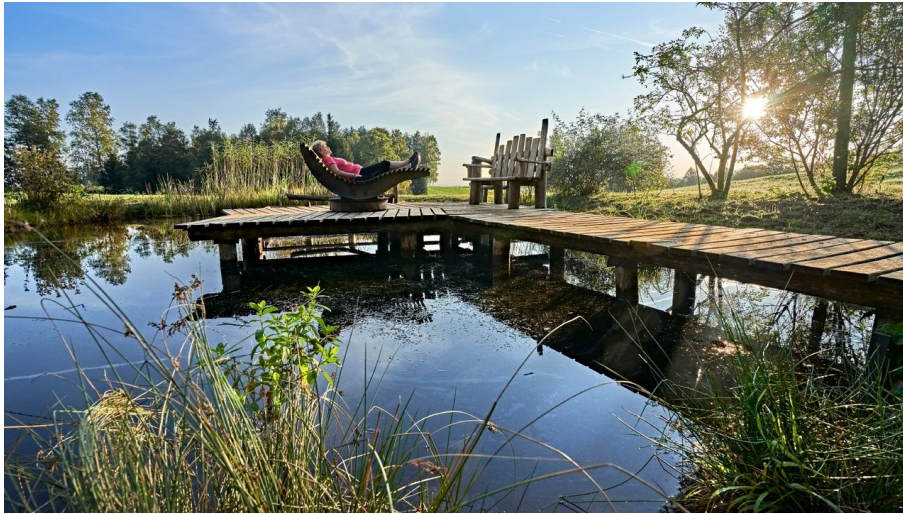
Moorlehrpfad Bad Kohlgrub