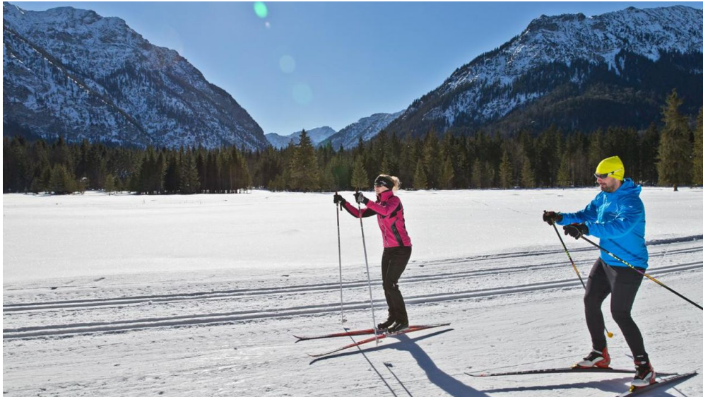
Verbindungsloipe Linderhof Graswang