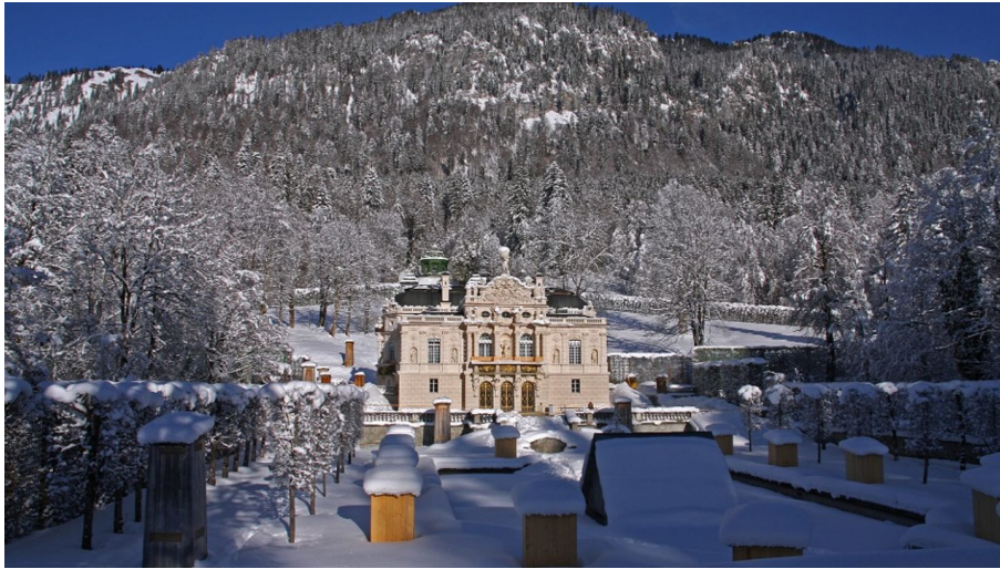
Verbindungsloipe Linderhof Graswang - Schloss Linderhof