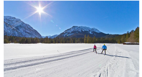
Verbindungsloipe Linderhof Graswang