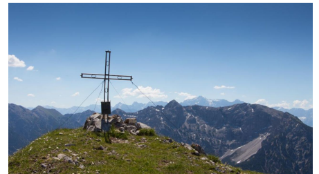
Bergtour - Hochblasse, Gipfelkreuz