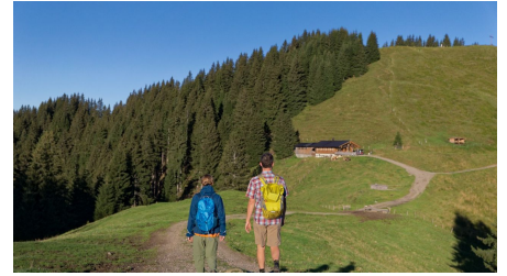
Wandern zur Hörnle-Alm