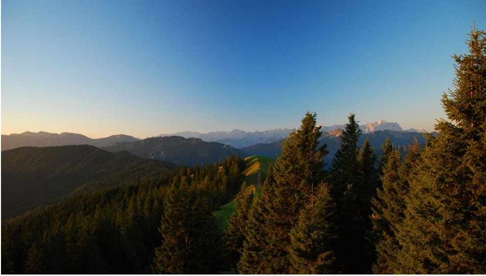
Blick vom hinteren Hörnlegipfel auf den Stierkopf