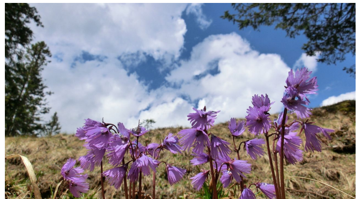
Auf der Hohen Bleick