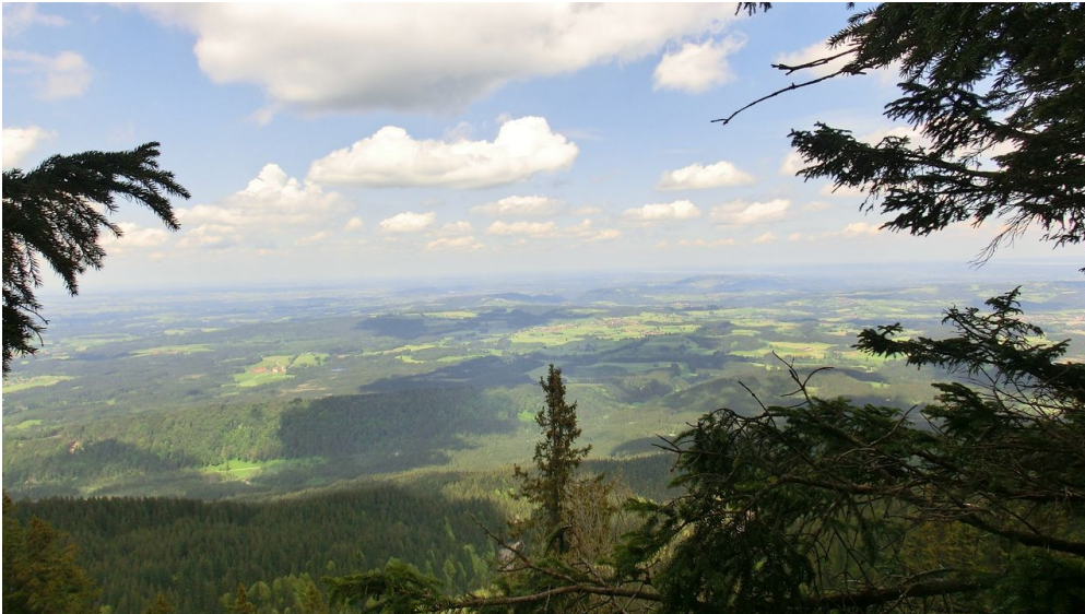
Blick ins Alpenvorland zur Wieskirche