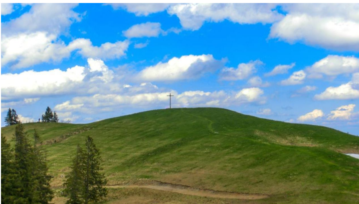
Niederbleick - © Thorsten Unseld, Florian Leischer