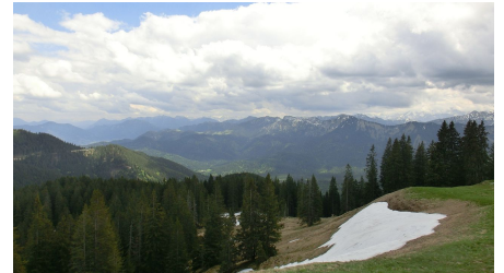
Gipfel Niederbleick