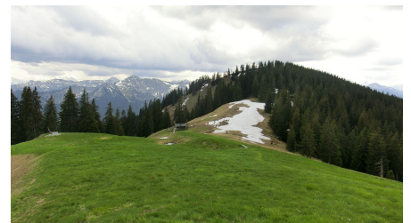
Gipfel Niederbleick, Bleick Hütte