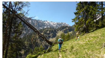
Weg zum Kuchelbergkopf