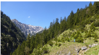
Weg zum Kuchelbergkopf