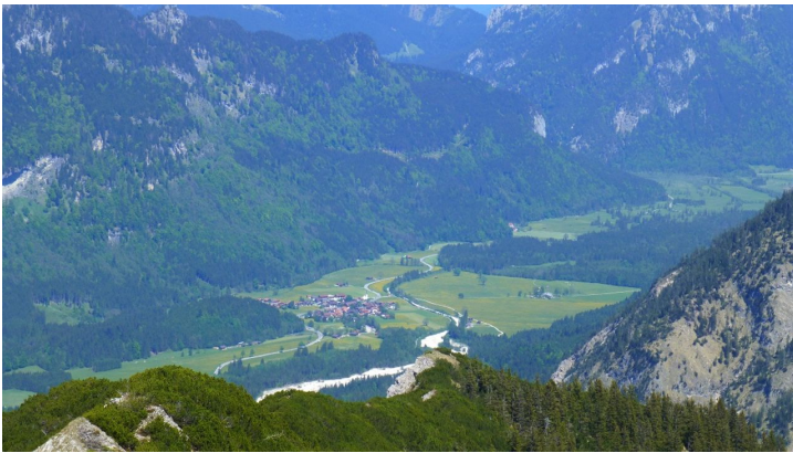
Blick ins Graswangtal