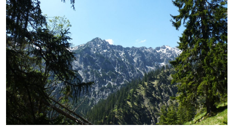
Blick vom Weg auf den Kuchelbergkopf