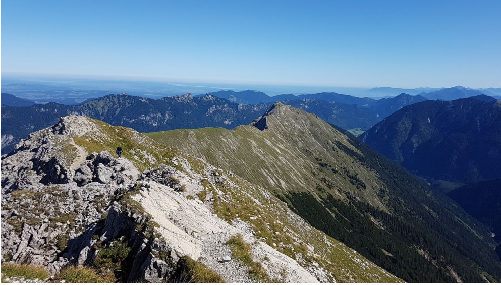
Blick auf Kuchelbergkopf und Kuchelbergspitz