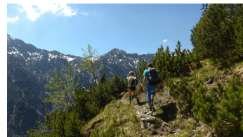
Weg zum Kuchelbergkopf