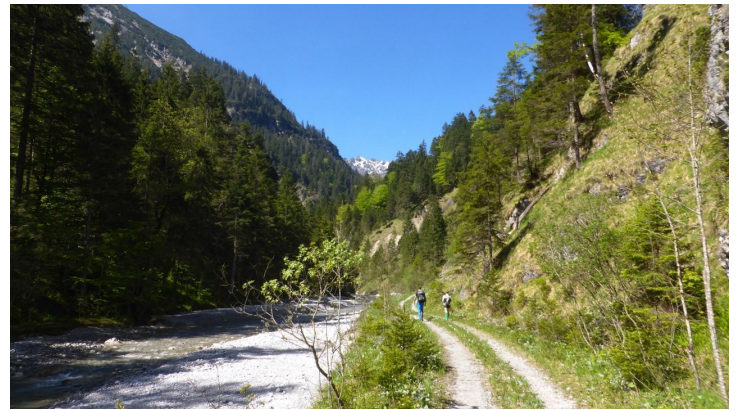
Der Fürstenweg