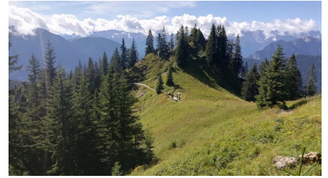
Weg zum Laber