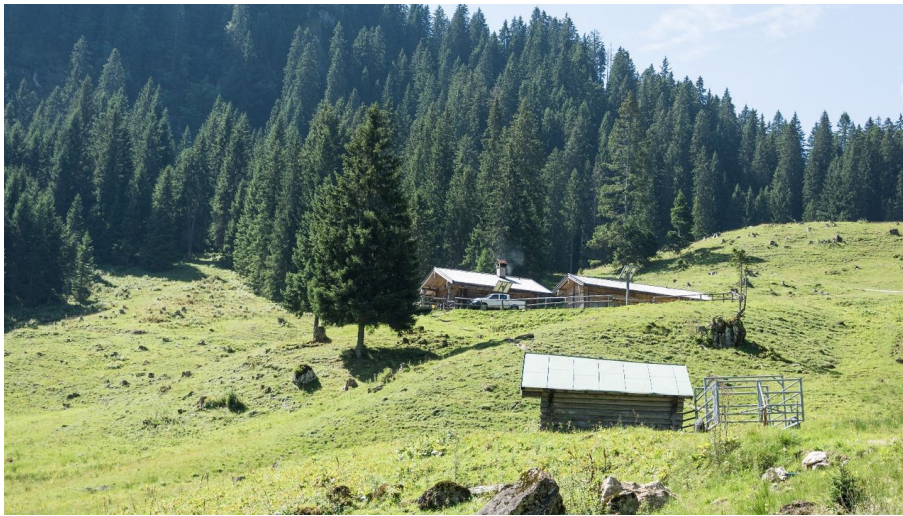
Blick auf die Soila-Alm