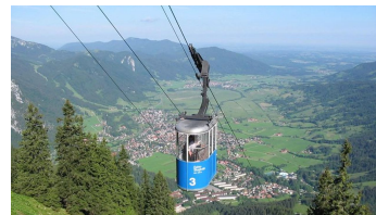
Naturpark Ammergauer Alpen