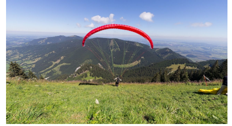
Gleitschirmflieger am Laber