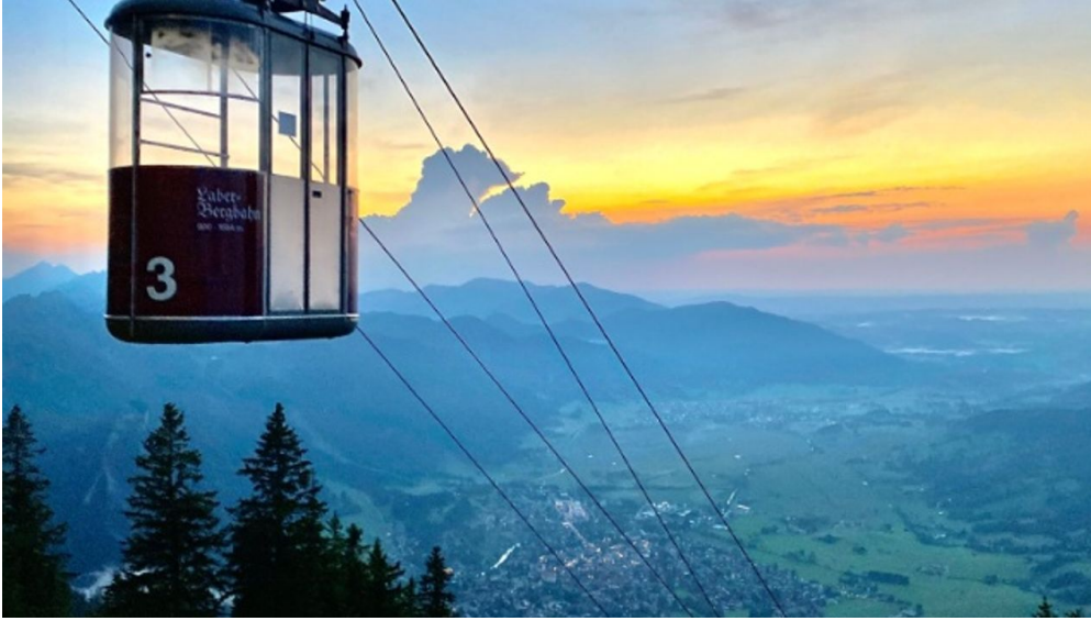
Laber-Bergbahn am Abend