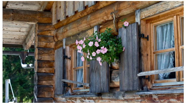
Soila Alm